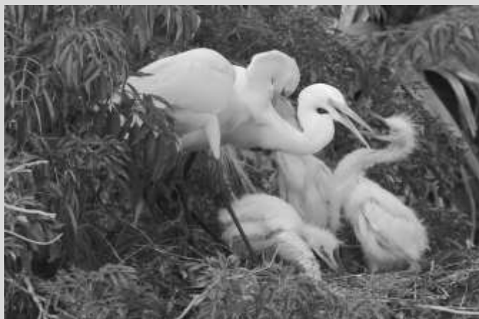
Egrets comúnmente hacen sus nidos en áreas ribereño.