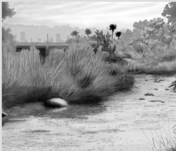
Figura 1 Vivienda de Alto

Áreas de Ribereño con o sin agua todo el año.