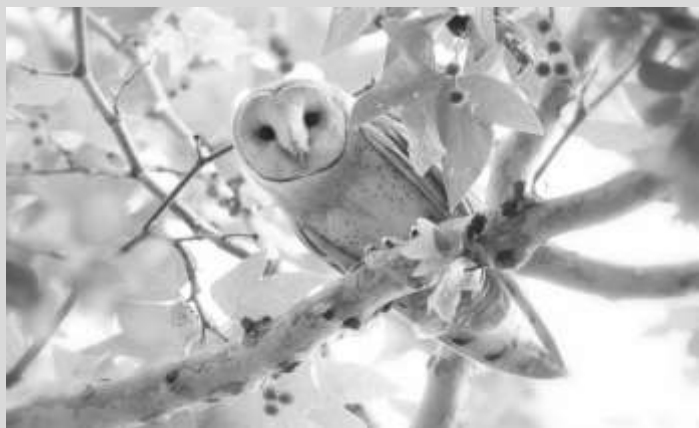
Tecolotes son encontrados es áreas de calidad alta de la corona del árbol donde se encuentra bien cubiertos