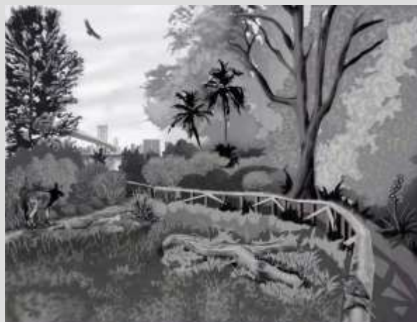
Figura 2 Vivienda de Valor Alto

Áreas de Ribereño con o sin agua todo el año.