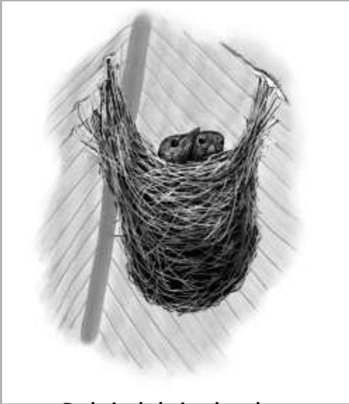
De bajo de hojas de palma

Mire de cerca estos tres lugares difícil de detectar