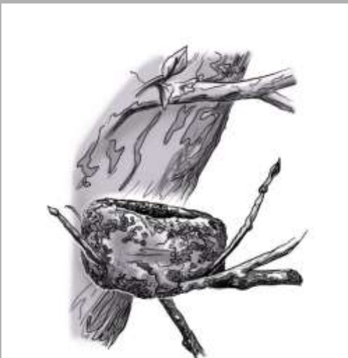
Nido de Colibrí es 2" en diámetro