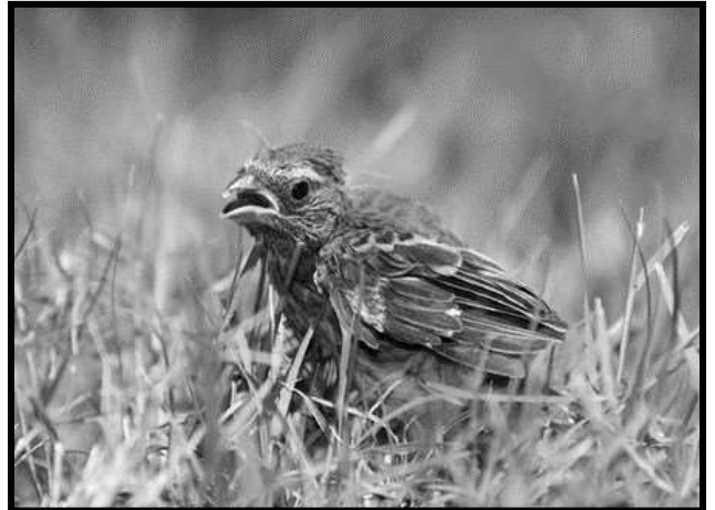
Inmaduro songbird de Four Oaks

Muchas leyes y regulaciones protegen las vidas silvestres. El acto Federal de Migratoria Bird Treaty Act, 1918 informa es contra la ley matar o lastimar pajaros nativos, novatos, huevos o nidos activos. Esto incluye ponerlos en riesgo, asustando a los padres de irse de los huevos o de sus hijos.