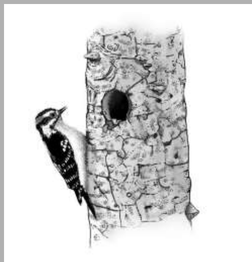
A bujeros el tronco de árbol muerto o ramas

La mayoría de los nidos están protegidos. El grado de protección depende de la especie y la ubicación.