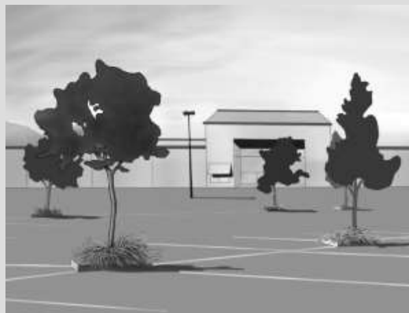
Figura 3 Vivienda de Valor Menor

Áreas grandes con árboles maduros, algunos árboles muertos, vvegetación del sotobosque.