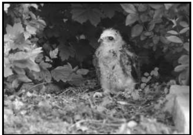
Inmaduro Red-tailed Hawk por David Watkins

Si usted encuentra lastimada una vida silvestre o inmadura afuera del nido, llame al centro de rehabilitación de vida silvestre antes de intervenir. Los padres probablemente continuaran cuidando de los pájaros inmaduros que se han caído del nido. Es contra la ley llevarse un pájaro silvestre para la casa como mascota.